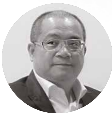
SHI Jianshe Xiamen Yicheng Trading Co. Ltd

A Colorvation fontos tényező volt abban, hogy a járműfényezési ágazat vezető szereplői cégünket választották partnerüknek. Igazából a Colorvation részét képező partnereink a digitális színmeghatározás jövőjének kialakításában is közreműködnek.